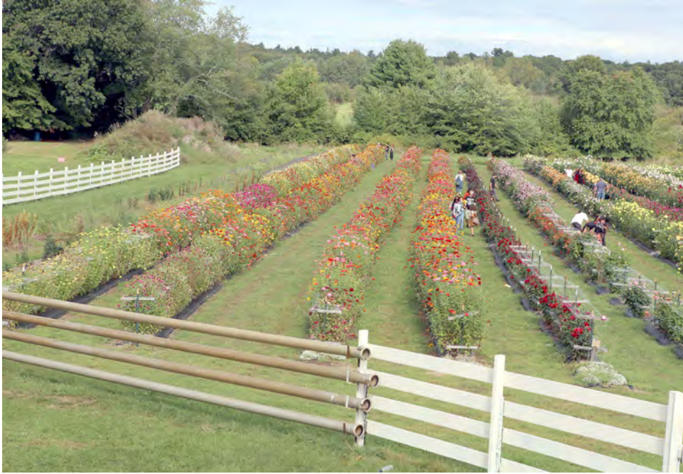
Uma bonita herdade de frutas e flores em Rhode Island.

Slater Mill, Pawtucket; Route 110, Great Swamp Wildlife, Reservation. Goddard Memorial State Park.