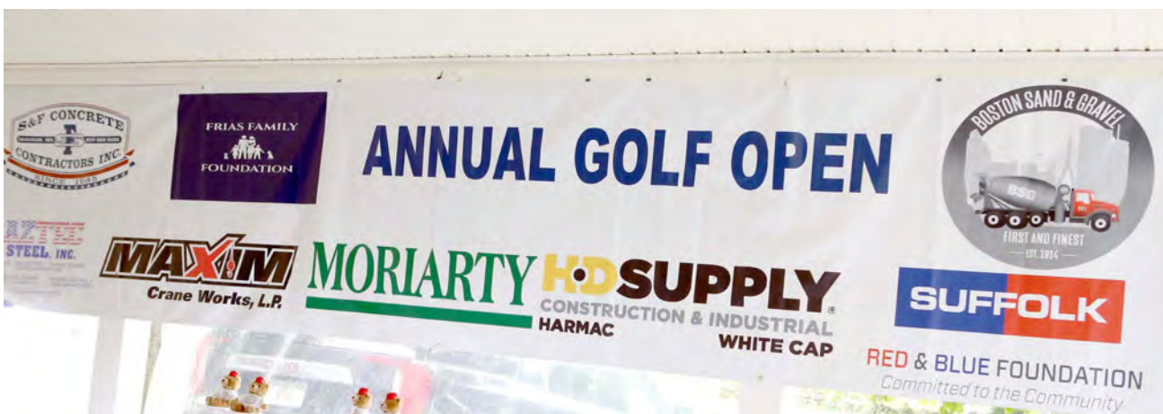
Algumas das firmas que apoiaram o I Torneio de Golfe da Frias Family Foundation