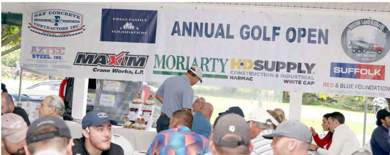
Um momento de convívio entre os participantes do I Torneio de Golfe da Frias Family Foundation