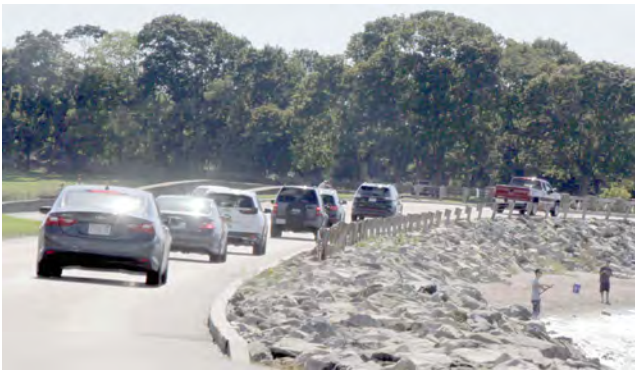
Vários aspetos da bonita paisagem do Colt State Park em Bristol, RI, local onde se realiza a prova de atletismo integrada nas celebrações do Dia de Portugal/RI 2021.