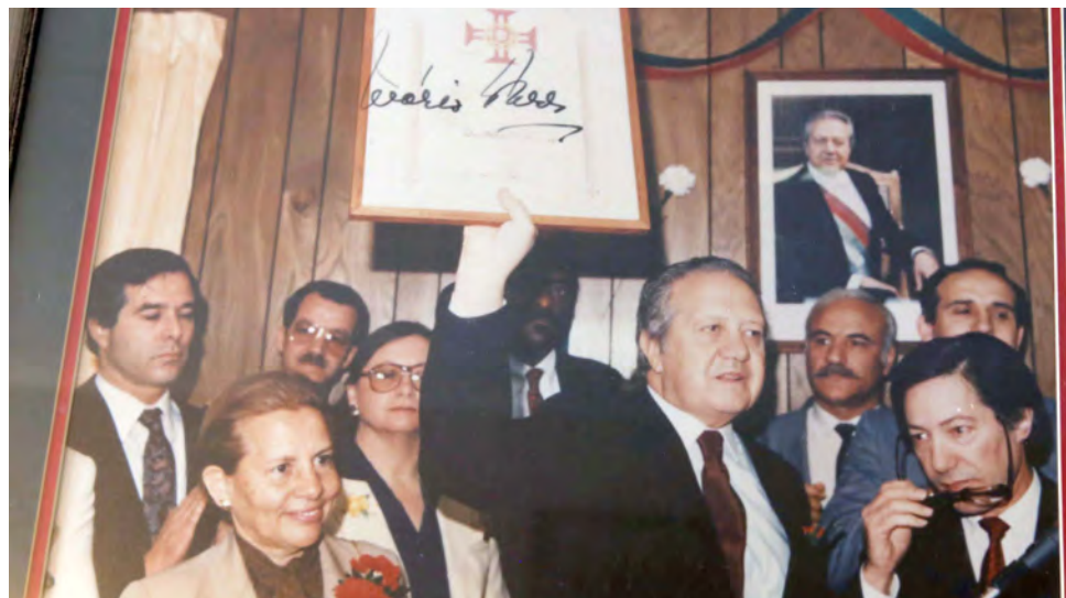
A foto documenta a histórica visita do então Presidente da República Portuguesa, Mário Soares ao Clube Juventude Lusitana, a 24 de junho de 1987, na foto exibindo uma placa com o emblema da popular coletividade portuguesa de Cumberland, RI, a celebrar este ano 100 anos de existência.