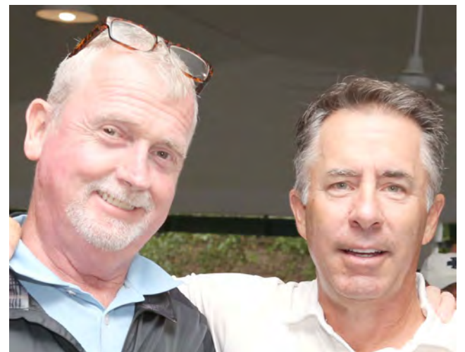
Dois participantes no I Torneio de Golfe da Frias Family Foundation.