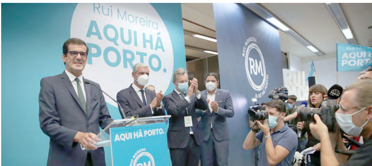
Rui Moreira celebra a sua reeleição como presidente da Câmara Municipal do Porto no passado domingo.

Mais de 9,3 milhões de eleitores podiam votar no domingo nas autárquicas, às quais se apresentaram mais de duas dezenas de partidos e mais de 60 grupos de cidadão. Nestas eleições, a abstenção foi alta – 46,3%.